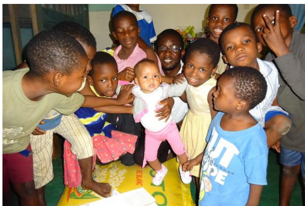
29-07) Spullen Azi Orphanage, 100.000cfa= €152,67 Ma Azi Ziekenhuis rek., 100.000cfa= €152,67

De stichting blijft de weeshuizen in Kumba altijd steunen op welke manier dan ook. Afgelopen jaar heeft het team in Kameroen hen regelmatig bezocht met 1 maal als hoogtepunt een groot gift. De moeder van Azi Orphanage is ernstig ziek en ook haar hebben we geholpen om naar het ziekenhuis te gaan. Wanneer de kinderen ziek zijn neemt de stichting hier de verantwoordelijkheid voor door ze naar het ziekenhuis te brengen. Ook gaan we regelmatig naar het weeshuis om te spelen met de kinderen. Geweldig om te zien hoe blij ze zijn met deze bezoeken.