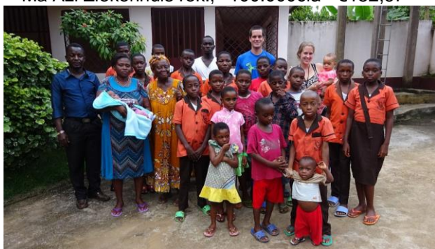
22-09) Spullen Delegate Orphanage, 100.000cfa = €152,67