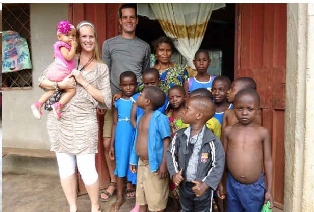
07-09) Spullen Frathekk Orphanage 50.000cfa = € 76,34