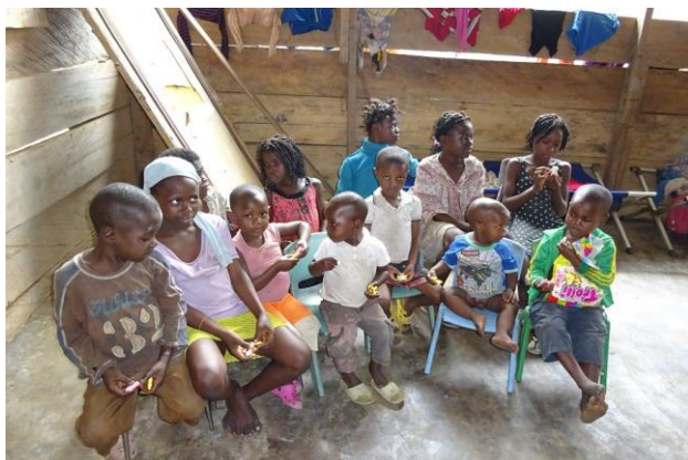
05-08) Spullen Clephic Orphanage, 100.000cfa = €152,67