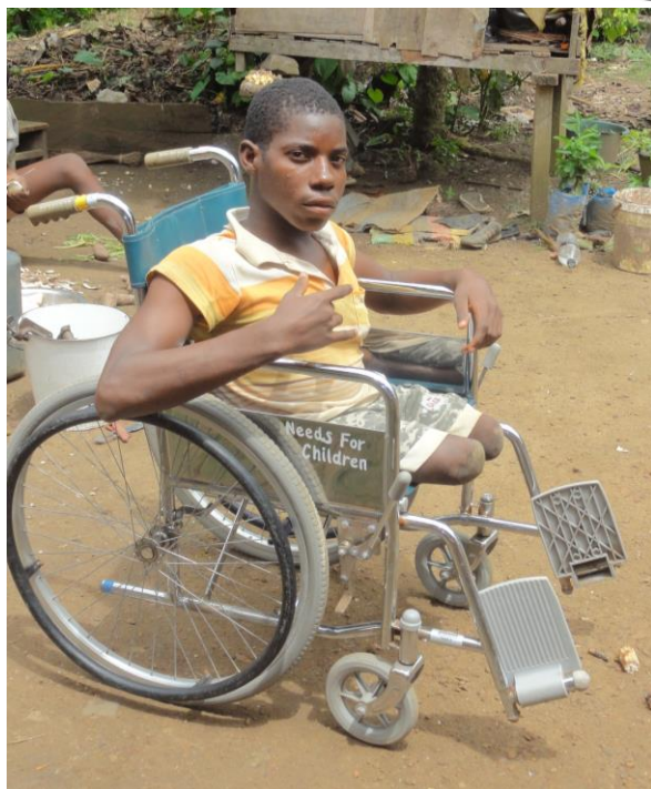
Extra kosten naast de rolstoel: 15 000 cfa = € 22,90