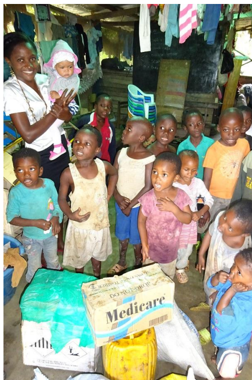
30-07) Spullen Mah Di's Orphanage, 100.000cfa = €152,67